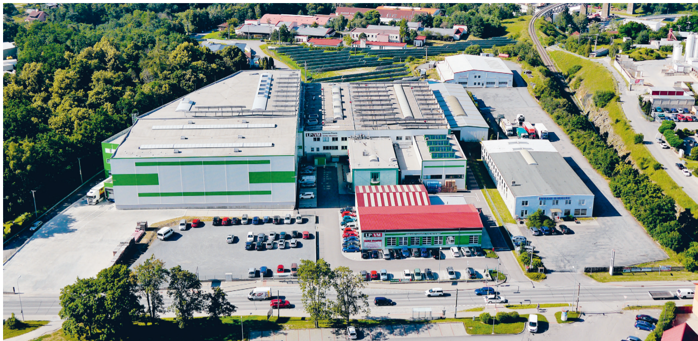
Celkový pohled z dronu na areál firmy.

Jsmo tým nadšených profesionálů a špiček v oboru.